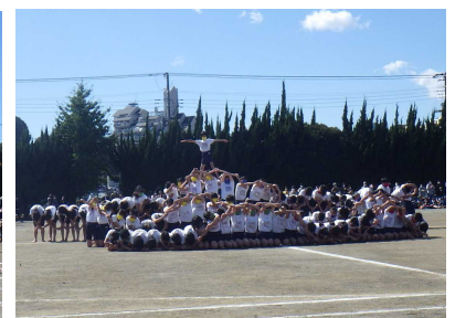
高学年「THE GREATEST SHOW」