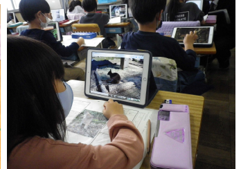
タブレットを活用した授業