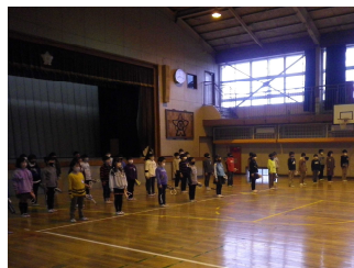
12/14 音楽朝会 (2年)