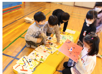
12/16 冬まつり (1・2年)