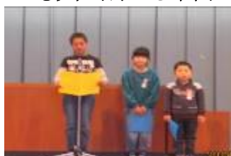
3学期始業式(児童代表の言葉)