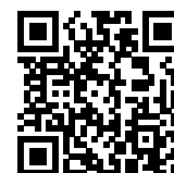
連絡メール2 保護者ログイン

* 保護者登録しているメールアドレスがご利用できない場合は、パスワードの再設定ができません。